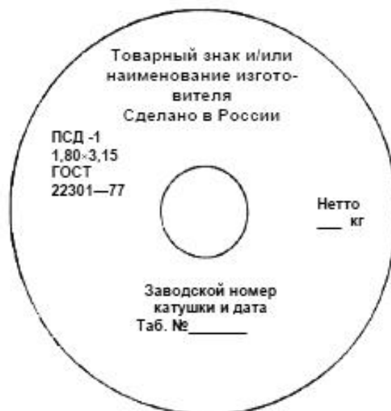
Рисунок А.2 - Расположение маркировки на ярлыке, прикрепленном к катушке